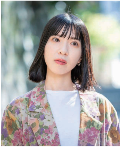
シンガー・ソングライター すぎうらかなこ