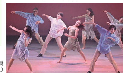
「3 Things」

を見た。ジャズ、ヒップホップ、タップ、バレエそれに歌のコーラスなど、クラスごとの発表会であった。幼児から教師まで全24作、ソロもあれば10数人の群舞もあった。秋の本公演のようなキラキラしたムードはなく、出演者たちがダンスをエンジョイしているのが分かる。ジュニアバレエ「崖の上